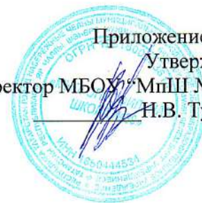
График работы родительского контроля за организацией питания детей в МБОУ «Многопрофильная школа №39»